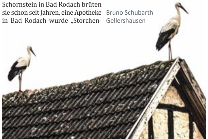
Zwei Weißstörche am 21. März in Gellershausen.