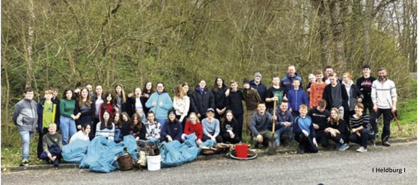
I Heldburg I